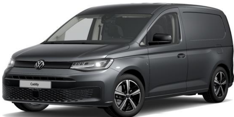
Indium Grey (X3X3) Metallak