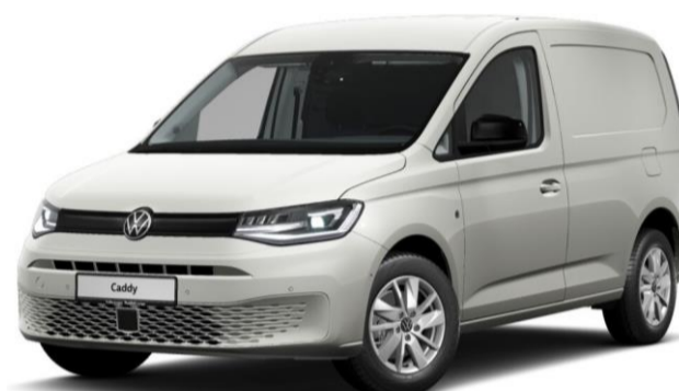
Pro Udover Comfort udstyr