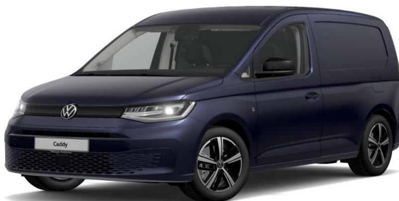
Starlight Blue (3S3S) Metallak

Detailprislister, Priskode R03, Modelår 2025