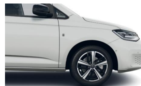
17" Colombo alufælge i sort/sølv

Nedenstående farver er de mest populære. Se flere farver hos din lokale Volkswagen forhandler. Bilerne er vist med ekstraudstyr.