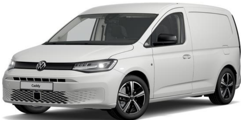
Candy White (B4B4) Standard lak

Nedenstående farver er de mest populære. Se flere farver hos din lokale Volkswagen forhandler. Bilerne er vist med ekstraudstyr.