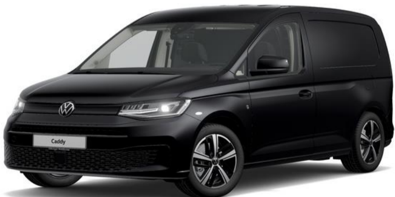
Deep Black (2T2T) Perleeffekt