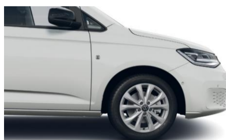
17" Barahona alufælge i brilliant sølv