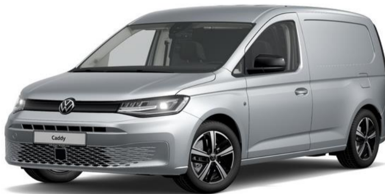
Reflex Silver (8E8E) Metallak