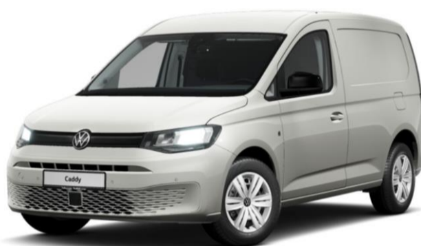
Comfort Udover basis udstyr