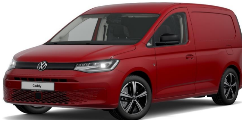
Cherry Red (4B4B) Unilak