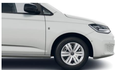
16" stålfælge med heldækkende hjulkapsler